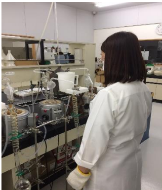
保存料検査：水蒸気蒸留による抽出

食品の腐敗や変敗を防ぐために、ちくわやかまぼこなど、漬物、しょう油などの食品には、ソルビン酸や安息香酸などの「保存料」の使用が認められています。また、ハムやソーセージなどの食品には、肉の色を保つために亜硝酸ナトリウムなどの「発色剤」の使用が認められています。これらの食品添加物を使用する際は、使用が認められた食品であること、また、使用基準が定められた食品添加物では、使用量を守ることが求められます。ならコープでは、保存料や発色剤などの食品添加物が使用されている場合は、使用量に問題がないか、また、食品に表示されずに、使用されていることがないかなどを検査（外部検査機関への依頼も含む）で確認しています。