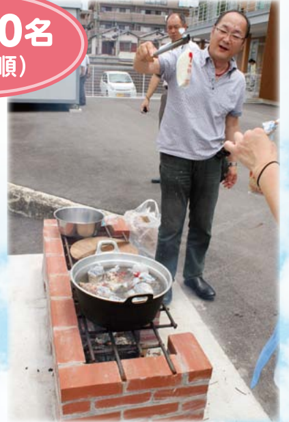
かまどベンチを使って 非常食の炊き出しをします。