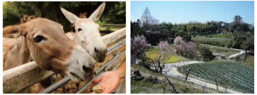
【写真】上:杉五兵衛の外観/下:園内のロバたち/右:農園の春の様子いずれもイメージ