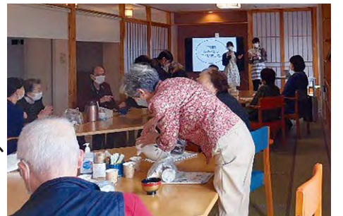
あすならホーム郡山 あすなら学習会

協同福祉会では地域貢献活動としてあすならサロンでのランチ企画、買い物バス、つながり連絡員制度、ユニバーサル就労、こども食堂(一部の施設のみ)など積極的におこなっています。地域の方にお役立ち情報の発信するため、春と秋にあすなら学習会も開催しています。