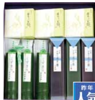
涼菓伊織の水羊羹