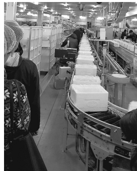
物流センターでのようす

保冷箱は軽いので、雨や風で飛ばされると傷つきやすく汚れの原因になります。みんなで使う箱なので、ご家庭でも大切に扱い、翌週には配達の職員に返却しましょう。また、内掛け袋はリサイクルのために回収しています。名前のシールは配達する際に剥がれないよう一定の強度を持たせています。剥がしにくい場合は切り取るなどして、紙（シール）がついていない状態での回収にご協力をお願いいたします。