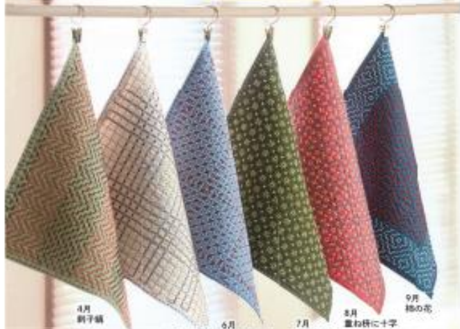
4月 刺し子 5月 花の丸 6月 くぐりに花刺し 7月 花入り格子 8月 雲お餅に十字 9月 桜の花

ふきんや日除け、3こお弁当を包んだり...いろいろなところで大活躍 図案は プリント済み 文様をお洒落に紡ぐモダンカラーの 一目刺しふきんコレクション 注文番号 142905 月々 本体価格 1,480円 ×6回 税込 1,638円 制作時間 約12~24時間(約2時間×6~12日)