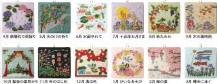
4月 雛雛花で雨降り 5月 天の川の新や 6月 水田ゆれて 7月 十五夜お月さま 8月 秋たわわ 9月 木の葉時雨 10月 藍染の藍朝がら 11月 年のはじめ 12月 鬼は外 1月 ひいなあそび 2月 桜の宴 3月 春先に氷

可愛らしい季節を彩り飾る「なつめ(しつらい)」を、今の暮らしに合わせたお洒落やかなデザインに、刺して飾って、身近に楽しむ「しつらい」をはじめましょう