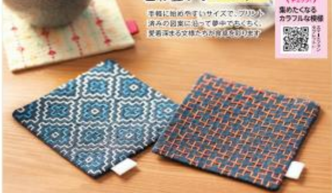
4月 玉すだれ・角亀甲 5月 桜の花・十字つなぎ 6月 花紋・菊が亀甲 7月 米刺し・十字花刺し 8月 丸七宝・赤巻草 9月 鶴岡・梅枝

素材でかわいい刺し子コースターコレクション 注文番号 142450 月々 本体価格 1,200円 ×6回 税込 1,320円 制作時間 約7時間(約3.5時間×2日)