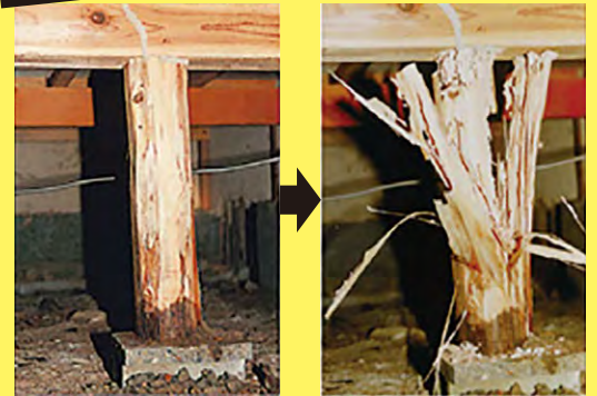
束柱の被害 内部は食われてボロボロに。