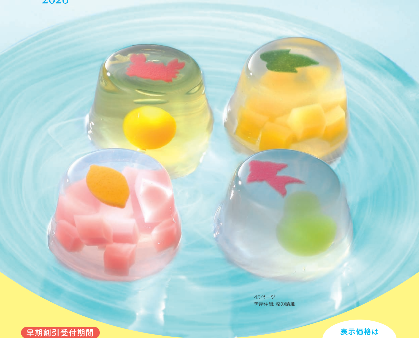
45ページ 笹屋伊織 涼の晴風