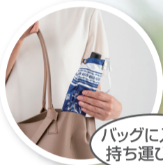
バッグに入れて 持ち運び便利