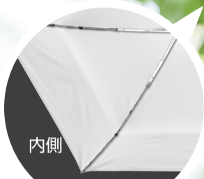
内側 アイボリーの内側は お顔が明るく 見える白色