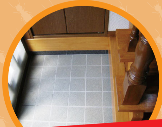
玄関や床のぶかつき