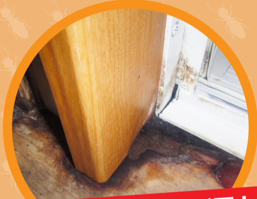
浴室・台所の水漏れ