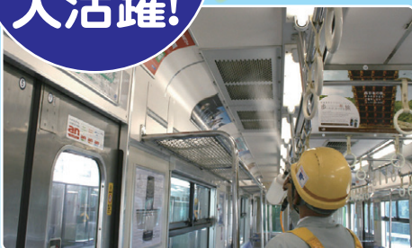
JR西日本鉄道の車両内の除菌・消臭