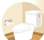
トイレリフォーム