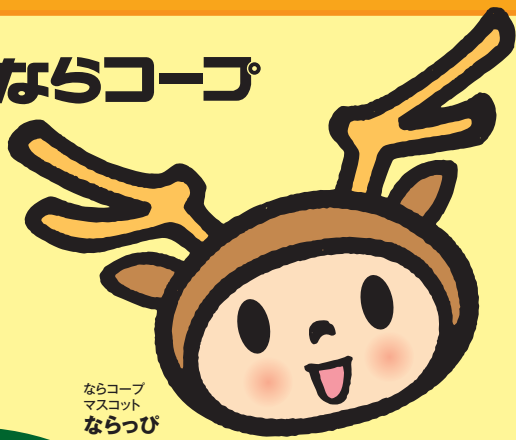
ならコープ マスコット ならっぴ