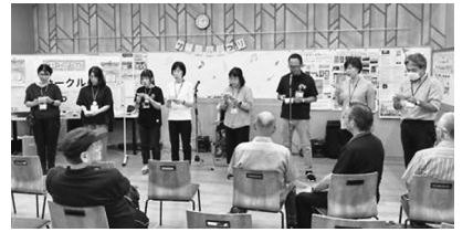
中エリア理事と中エリア本部

ステッチ刺繍作品がありました。他に、阪神淡路大震災の記憶を風化させず、防災意識を高めることを目的に活動している「桜（鎮魂）の会」の活動紹介。「グッヘルマミ」のブースでは、骨密度測定や握力測定などの体験ができました。