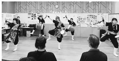
エイサーチーム『ちゅらら〜』と 沖縄エイサー パープルズ