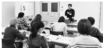
組合員のつどいの様子