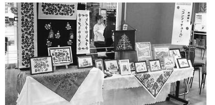
コンフィチュール